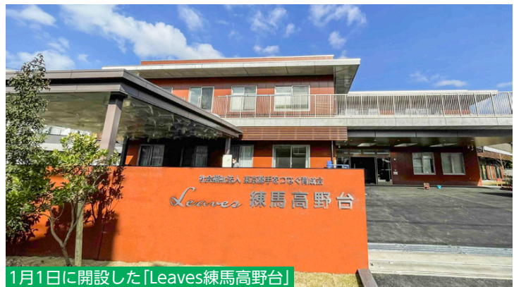
1月1日に開設した「Leaves練馬高野台」