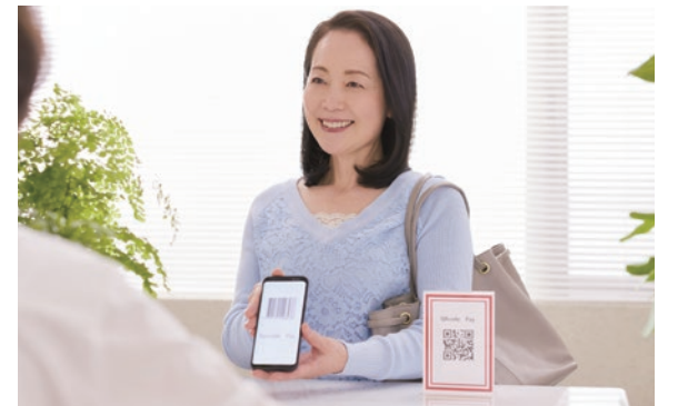
11～12月に PayPayポイント還元キャンペーンを実施します

SNS等を活用した魅力発信を意欲的に行う商店街に対する補助制度を創設しました。練馬区商店街連合会と連携して、スマート商店街プロジェクトを進め、デジタル化を推進します。