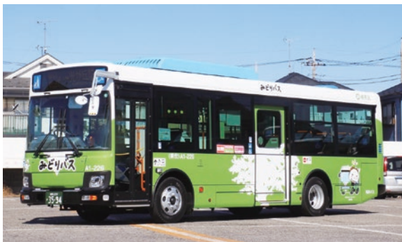
ルート再編により利便性を向上させます

来月、保谷ルートを再編し、公共交通空白地域である区北西部の利便性を向上させるとともに、保谷駅バス停を南口から北口に変更し、踏切の横断をなくすことで運行の定時性を確保します。また、練馬光が丘病院の開院に合わせて、光が丘駅周辺の3ルートを病院まで延伸し、病院利用者の利便性を向上させます。