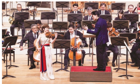
真夏の音楽会の様子

現在、豊島園駅駅舎及び駅前広場の再整備が進められています。公園と駅前広場に接する区道については、景観に配慮しながら、歩行者が安全で快適に通行出来るよう整備を行います。