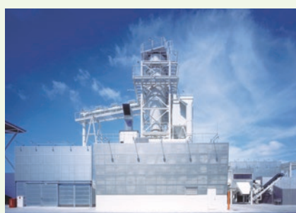
(株)リーテム東京工場

小型家電のリサイクル工場などを見学し、ごみの減量化・資源化について考えます。▶ 対象: 小学生と保護者 ▶ 日時・場所: 11月5日(土)午前8時資源循環センター集合～(株)リーテム東京工場～葛西臨海公園～午後5時集合場所解散 ▶ 定員: 20名(抽選) ▶ 申込: ハガキまたはファクス、電子メールで①催し名②住所③参加者全員の氏名(ふりがな)・年齢④電話番号を、10月7日(必着)までに〒177-0032 谷原1-2-20 資源循環センター ☎3995-6711 FAX 3995-6733