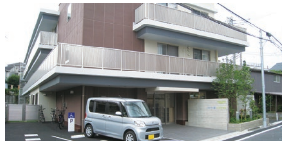
昨年開設した特別養護老人ホーム「あおぞら緑 小竹テラス」

既に施設数が都内最多である特別養護老人ホームは、来年度2施設を開設、1施設を増床し、定員を177人増の2,422人とします。令和7年に向けて、4年度以降は、4施設の整備、1施設の増床により、定員を2,878人とします。