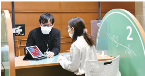
申請書一括作成システムの導入により、何枚も書類を書く必要がなくなりました

住民税や軽自動車税、国民健康保険料の納付手段に4月からPayPayを導入し、キャッシュレス化を進めます。また、国民健康保険料口座振替の申請手続きをウェブで可能とします。