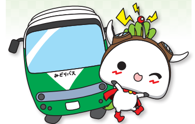
練馬区公式アニメキャラクター「わり丸」©練馬区