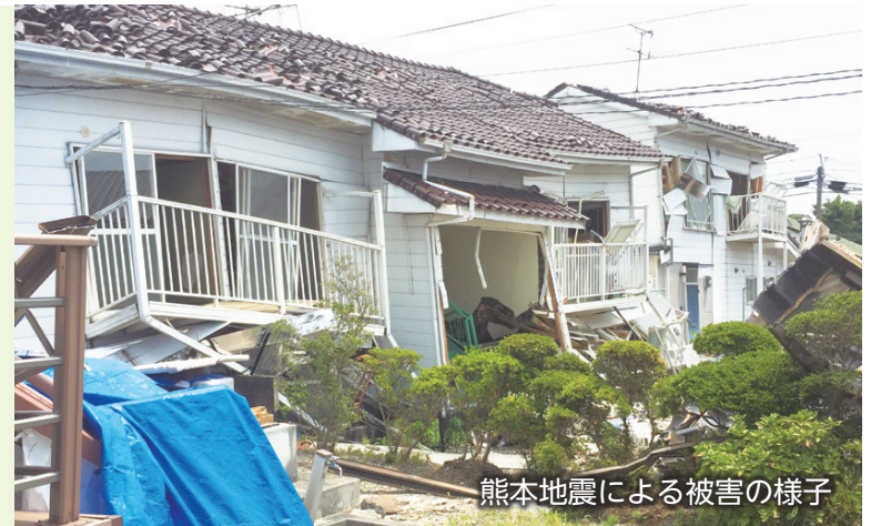
熊本地震による被害の様子

平成28年4月に発生した熊本地震では、倒壊した建物に昭和56年5月以前の古い耐震基準で建築された建物が多数ありました。区では、昭和56年5月以前に建築された建物を対象に、耐震診断や耐震改修工事などにかかる費用の一部を助成します。制度の概要など詳しくは、お問い合わせいただくか、区ホームページをご覧ください。