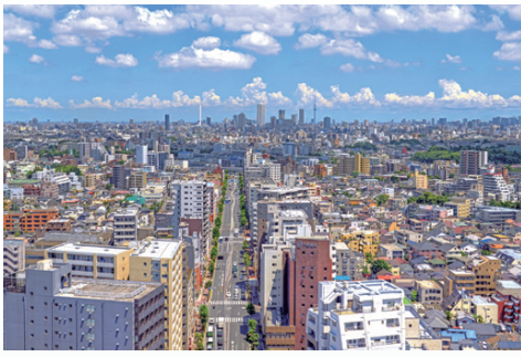
区役所20階展望ロビーからの眺め