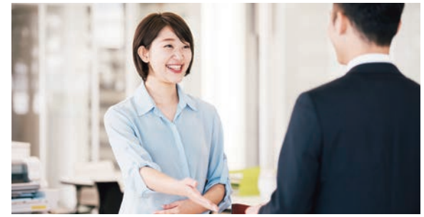
区役所の顔となる窓口改革を進めます

進担当がコーディネーターとなり、生活サポートセンターの職員とともに、各相談窓口の役割分担・サービス内容を調整し、最適な支援プランを作成します。