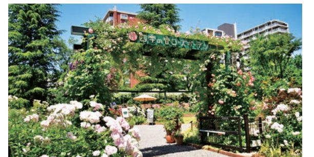
四季の香ローズガーデンを拡張します

四季の香ローズガーデンの拡張整備工事と、隣接する花とみどりの相談所の改修工事に着手し、来年5月、リニューアルオープンします。バラの植栽整備に、みどりの葉っぱい基金ローズガーデンプロジェクトの寄付金を活用します。上石神井3丁目の藝大石神井寮跡地で、近隣小学校の子どもたちや地域の皆様からの提案をもとに整備している公園は、4月に開園します。本定例会に、名称を「上石神井こもれび公園」とする条例改正案を提案しています。地域の皆様、日本大学芸術学部と協働し、改修してきた豊玉中いっちょうめ公園は、4月に開園します。