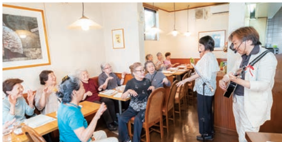
交流・相談・介護予防の拠点となる「街かどケアカフェ」

街かどケアカフェは、桜台地域集会所で開設するほか、地域団体や介護事業者と協働して7カ所増設し、30カ所に拡充します。また、コンビニ・薬局と連携した出張型街かどケアカフェは、新たに4カ所で開始し、合計9カ所とします。地域包括支援センターの区立施設等への移転・増設を進め、より身近で利用しやすいものとしします。