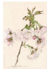
御車返 太田洋愛 個人蔵

桜のために全国を旅した太田洋愛(明治43年～昭和63年)が植物画の道に入ったきっかけは、牧野富太郎からの手紙と描画道具でした。今回、「日本桜集」の原画など約100点を展示します。▶ 場所・問合せ :牧野記念庭園記念館 ☎6904-6403