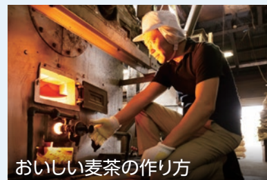
おいしい麦茶の作り方

8月21日(水)~24日(土)の4日連続で、区内在住の達人が教える夏を涼しく過ごす技を紹介します。▶問合せ:広報係 ☎5984-2690