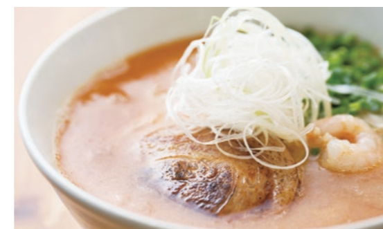
おすすめの「えび塩麺」

「ネリサポ」を知ったのは、売り上げの限界を感じ始めた頃。利益を伸ばすために何をすべきか相談したことが始まりでした。そんな中、共同経営で国分寺店を出店しま