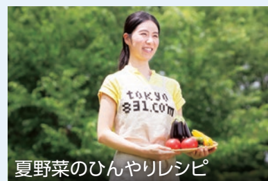
夏野菜のひんやりレンピ