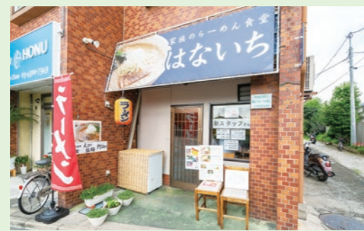
家族のらーめん食堂 はないち