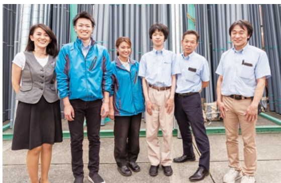
笑顔あふれる(株)角産の皆さん

障害によっては抽象的な表現が苦手、特定のものへの思い入れが強いなどの特性がありま