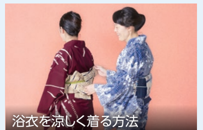
浴衣を涼しく着る方法