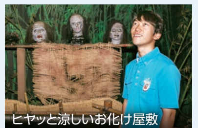
ヒヤッと涼しいお化け屋敷