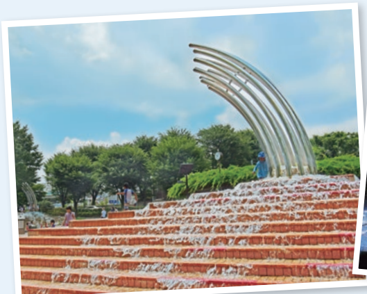
大泉中央公園のじゃぶじゃぶ池