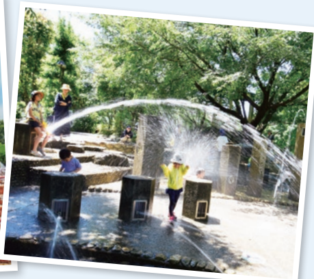
立野公園のじゃぶじゃぶ池