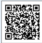
二次元バーコード

練馬区公式フェイスブックでは、区の最新情報や四季の景色、おすすめスポットなど、練馬の魅力を発信しています。8月は、涼しく過ごせるスポットや、熱中症対策などを紹介中!ぜひ、ご覧ください。▶問合せ:広聴広報課庶務係 ☎5984-2694