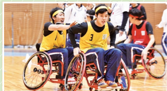
車いすリレー (車いすを使ったリレー)