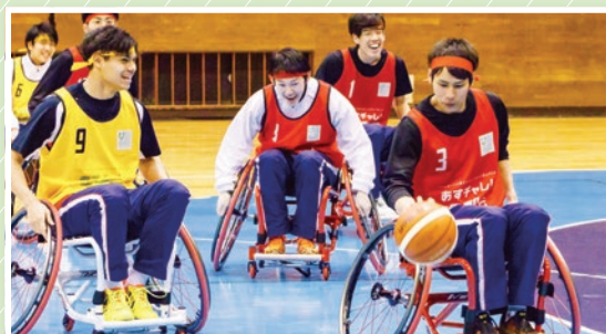
車いすポートボール (ゴールは人が担い、車いすで移動するバスケットボール)