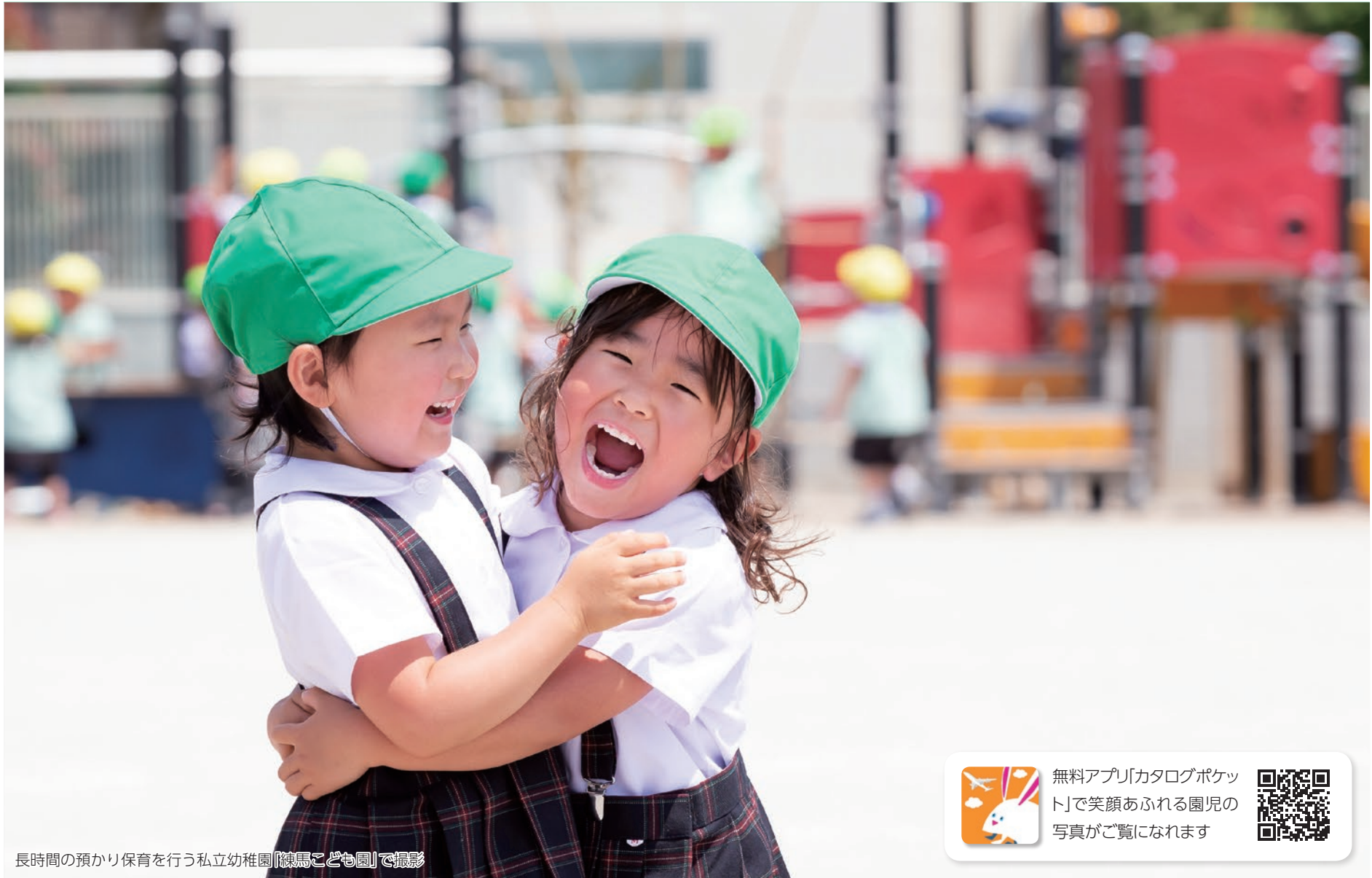
長時間の預かり保育を行う私立幼稚園「練馬こども園」で撮影