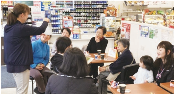
コンビニエンスストアなどを活用した「街かどケアカフェ」

また、コンビニエンスストア3カ所、薬局2カ所で、イートインスペースや待合室を活用した新しいスタイルの街かどケアカフェを開始します。各店舗で、地域包括支援センターによる体操や講座、相談会等を実施し、身近な場所で介護予防に取り組める環境づくりを更に進めていきます。