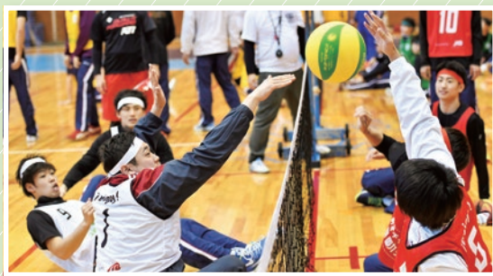
シッティングバレーボール (座った状態で競技をするバレーボール) パラリンピック正式種目