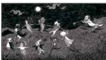
《輝ける鼻のどんぐり》1969年 挿絵・原画 ペン・インク・紙