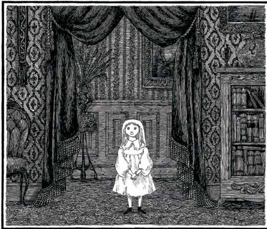
There was once a little girl named Charlotte Sophia.