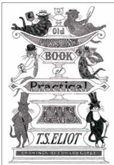
《キャッツ ポッサムおじさんの実用猫百科》1982年 表紙・原画 ペン・インク・紙

▶観覧料:一般1,000円、高校・大学生と65~74歳の方800円、中学生以下と75歳以上の方無料 ※一般以外の方は、年齢を確認できるものが必要です。