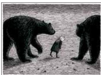
《ギャシュリークラムのちびっ子たち》1963年 挿絵・原画 ペン・インク・紙