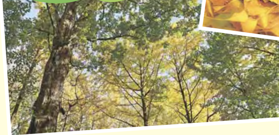
例えば…練馬区の特徴である「みどり」

みどりは潤いや豊かさを与えてくれる一方、落ち葉の処理や日照への影響などの課題があります