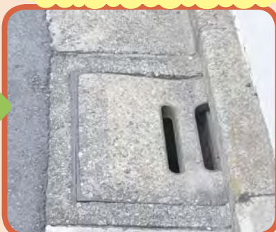
穴の開いた排水溝を直しました