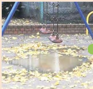
公園のブランコ乗り場

「ねりまちレポーター」とは、道路や公園遊具、区の設備の破損などをスマートフォンで撮影し、区へ投稿していただく方々で、現在約1,000名が登録しています。区は投稿内容を基に速やかに修理などを行います。 ※カーブミラーの新設などの設置要望や、道路拡張、施設の建て替えなど、長期の検討が必要な案件は対象外です。