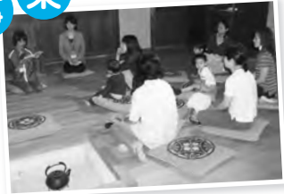
いろいろ端では昔ばなしの読み聞かせが楽しめます

①～⑥とも▷対象 小中学生(⑤を除く)▷とき・定員・費用 下表の通り▷ところ 旧内田家住宅(石神井町5-13池淵史跡公園内)④は石神井公園ふるさと文化館も▷申込 当日会場受け付け