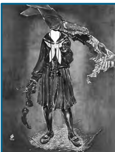
昭和46年「似而非機械」162.0cm×130.0cm 油彩・画布