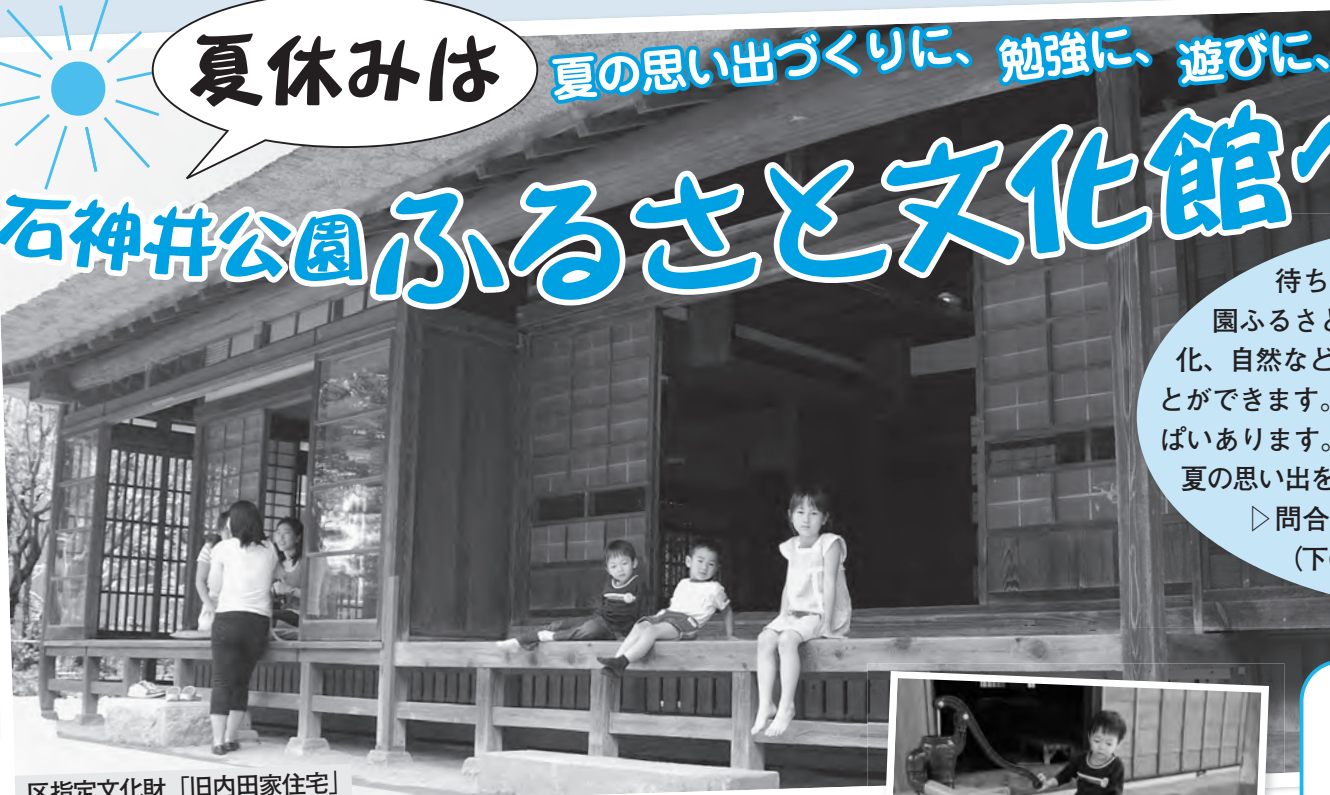
区指定文化財「旧内田家住宅」

待ちに待った夏休み。石神井公園ふるさと文化館では、区の歴史や伝統文化、自然などについて体験しながら楽しく学ぶことができます。夏休み期間中は、楽しい催しもいっぱいあります。石神井公園ふるさと文化館で楽しい夏の思い出を作りませんか。