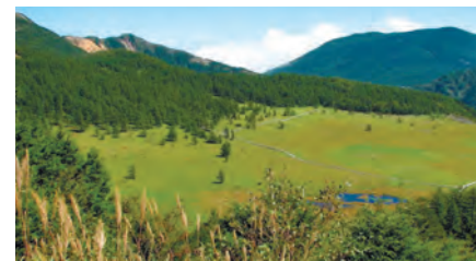
ベルデ軽井沢周辺の見所「池の平湿原」では美しい自然が満喫できます