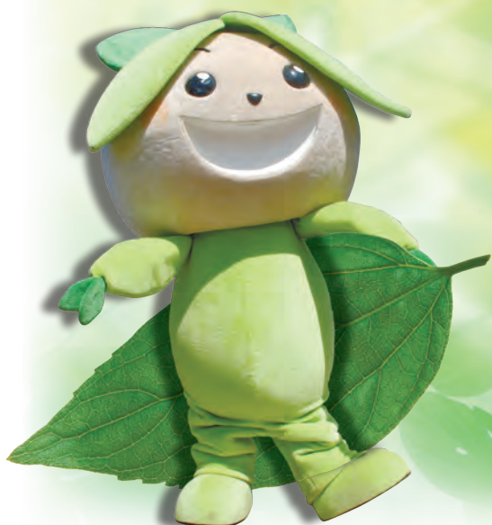
練馬みどりの葉っぱい基金キャラクター「ぴいちゃん」