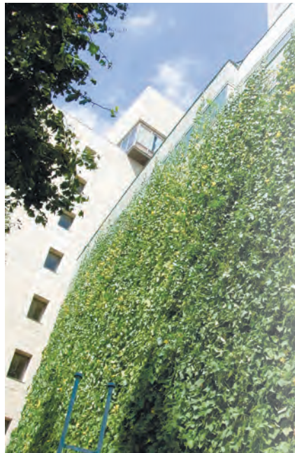
壁面緑化など「見えるみどり」を増やす取り組みを進めます

みどり30推進計画は、みどりを守り増やすため、区内の緑被率(※)を30%とすることを目標として平成18年12月に策定した計画です。今回、第一期事業計画〔19～23年度〕の事業実績とみどりの実態調査の結果を踏まえ、第二期事業計画(素案)をまとめましたので、あらましを紹介しま