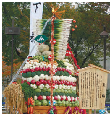
写真)の展示などを行います。

今年収穫された練馬大根を、葉付き泥付きのまま数量限定にて1本200円で特別販売します。また、会場ではJA東京あおばによる農園芸畜産物の品評会や即売会、野菜宝船(=写真)の展示などを行います。