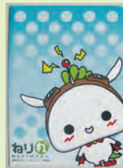
ねり丸クリアファイル

練馬区観光案内所(練馬駅地下1階)など で好評販売中です。区内 の事業者や団体の方は、 簡単な手続きでねり丸を 商品に活用できます。詳 しくは、アニメ産業振興 係 ☎5984-1276にお問 い合わせください。