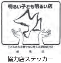
協力店ステッカー

健やか運動協力店は、子どもたちと触れ合う機会の多い商店の皆さまに、子どもたちへの声掛けや、非行防止の働き掛けに協力していただくものです(現在の協力店は1,713店)。11月の子ども・若者育成支援強調月間に合わせて、青少年育成地区委員会の委員が各商店に伺い、健やか運動協力店の説明と新規