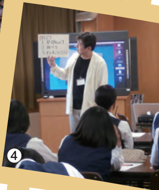
①昭和30年代のアニメーションの制作風景 ②日本初の連続テレビアニメ『鉄腕アトム』は昭和38年に放映が開始され、来年生誕50周年を迎えます ③『銀河鉄道999』でフルラッピングしている練馬区の電気自動車 ④プロのアニメーターによる区立中学校での出張授業風景

「ねりま区報」は、朝日・産経・東京・日経・毎日・読売の各新聞に折り込んでお届けしています。また、駅・金融機関・郵便局・公衆浴場・ファミリーマート・セブン・イレブンや区立施設にも置いています。