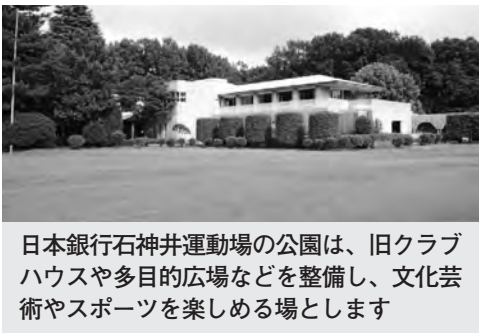
日本銀行石神井運動場の公園は、旧クラブハウスや多目的広場などを整備し、文化芸術やスポーツを楽しめる場とします