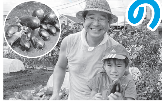
初心者でも収穫の喜びを味わえます