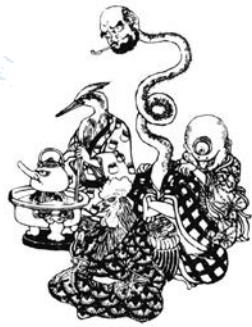
作/山東京伝 画/歌川豊国 「気替而戯作問答 ぎをかえて げさくもんどろ」より 明治大学図書館蔵

2月11日(祝)・26日(日) いずれも午後2 時30分～3時 当日会場受け付け ※ 当日の観覧券が必要です。