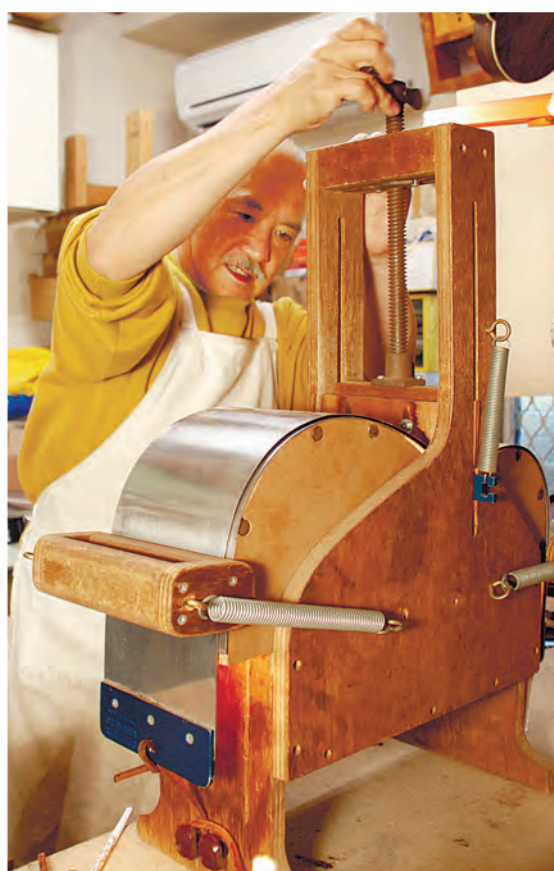
手でギターの側面の板を加工します。木材は厚いと曲がらず、薄いと強度がなくなるので、削るときにも注意が必要です。

「手作りのギターは、きちんとメンテナンスをすれば50年は持ちます。中程度の既製品を何本も持つより、自分に合った良一本を持つことをお勧めします。今後も、弾く人やその音楽を聴く人が喜べるギターを作っていきたいです。」