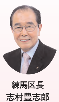
練馬区長 志村豊志郎

区民の皆さまには、さすががい新春を健やかに迎えることとお慶び申し上げます。昨年、東北地方を中心に甚大な被害をもたらした東日本大震災は、区民の皆さまの生活にも大