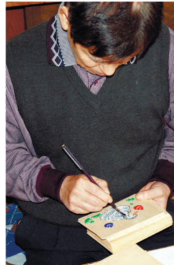
面相筆という細い筆を使い、細かい部分を描いていきます。ゆっくり描くよりは思い切って早く描いた方が良い絵が描けるそうです。