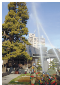
昨年の消防演習の様子

文化財防火デーに合わせて行われる消防署の消防演習を見学できます。※事前の申し込みは不要です。▶日時・場所:①1月24日(金)午前10時~10時30分…妙福寺(南大泉5-6-56) ②27日(月)午前10時~10時30分…南蔵院(中村1-15-34)▶問合せ:伝統文化係 ☎5984-2442