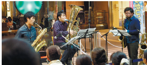
プロの演奏が間近で楽しめるまちなかコンサート