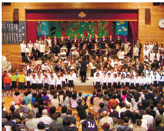
第21回を迎えた小竹の森音楽祭