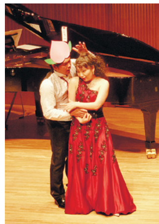
500円で楽しめるゆめりあワンコイン・コンサート(大泉学園ゆめりあホール)