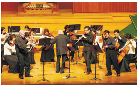
ベートーヴェンホールでの武蔵野音楽大学室内管弦楽団演奏会