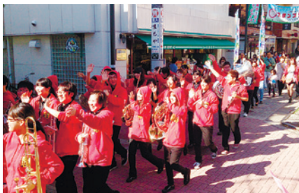
学園祭では江古田のまちをマーチングバンドがパレード