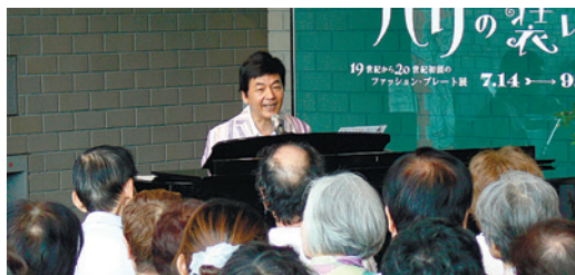
練馬区立美術館の企画展と関連したミニコンサート