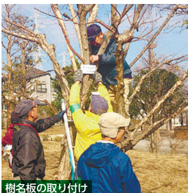
樹名板の取り付け