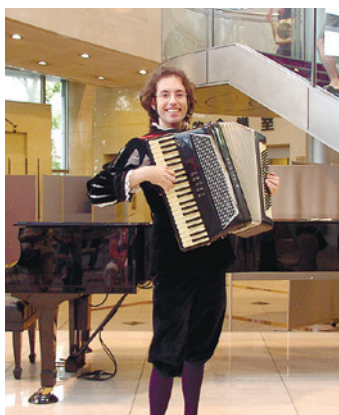
立ち見客が出るほど人気のアトリウムミニステージ(区役所)