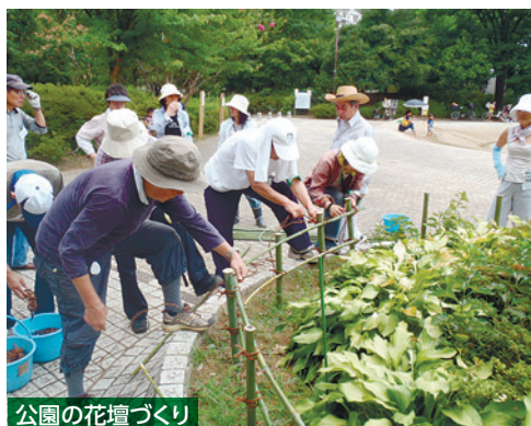
公園の花壇づくり