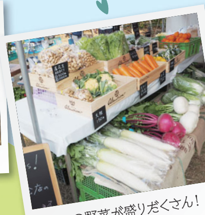
旬の野菜が盛りだくさん!