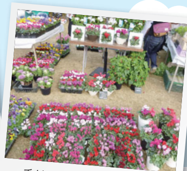
季節の花が色とりどり!