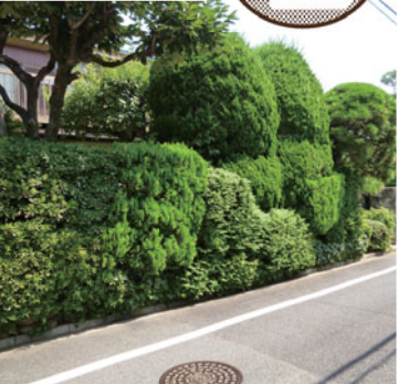
とっておきの風景(混ぜ垣)