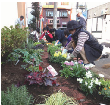
景観まちなみ協定(春日町)