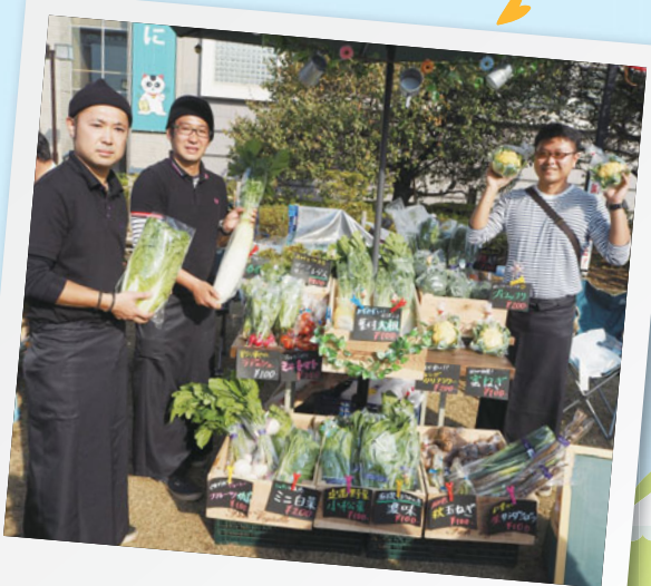
生産者と触れ合える!

区内の農家の方などが、練馬産の野菜や花のほか、練馬産の農産物を使った飲食物・加工品などを販売する「ねりマルシェ」を開催します。ぜひお越しください。 ※小雨決行。▶問合せ:農業振興係 ☎5984-1403