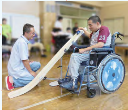
リオデジャネイロパラリンピックでも話題となったボッチャを体験しませんか

今回、2020年東京パラリンピックの正式種目「ボッチャ」をはじめ、さまざまなスポーツを体験できるユニバーサルスポーツフェスティバルを初開催します。区では、このフェスティバルを、障害のある方とない方の相互理解を深め、スポーツを始めるきっかけづくりの場としていきます。ぜひお越しください。▶持ち物:上履き▶申込:当日会場受け付け▶問合せ:スポーツ振興課振興係 ☎5984-1948 FAX 5984-1228