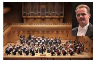
ルドルフ・ピールマイヤー、武蔵野音楽大学管弦楽団