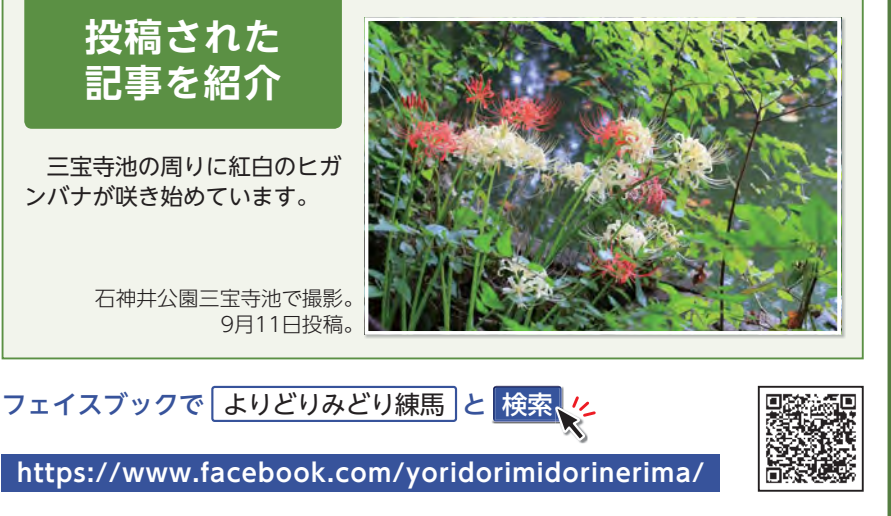
投稿された記事を紹介 三宝寺池の周りに紅白のヒガンバナが咲き始めています。 石神井公園三宝寺池で撮影。 9月11日投稿。

フェイスブックで「よりどりみどり練馬」と検索 https://www.facebook.com/yoridorimidorinerima/