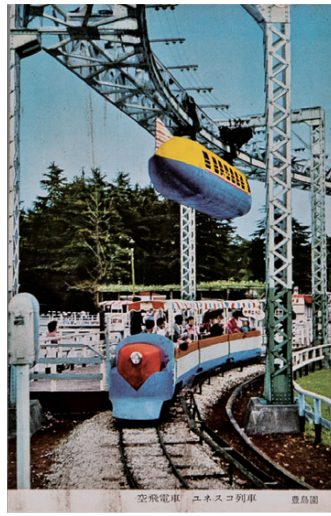
としまえん 昭和30年代後半

9月17日(土)~11月13日(日)に開催する石神井公園ふるさと文化館特別展「遊園地とねりま(仮題)」展に合わせて、戦前、現在の旭町に存在した兎月園など区内の遊園地の古い写真を募集します。写真は、記録保存するとともに、一部を展覧会で紹介します。