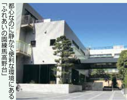
介護付き有料老人ホーム ふれあいの園 練馬高野台

広告 広告の内容については、各広告主にお問い合わせください。 ※広告掲載のお問い合わせは広報係 ☎5984-2690。