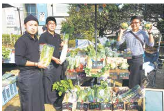
「ねりマルシェ」では生産者が心を込めて育てた練馬産の野菜を購入できます

練馬区商店街連合会は、昨年、若手の事業者が中心となって「まちゼミ」を初めて実施し、好評を