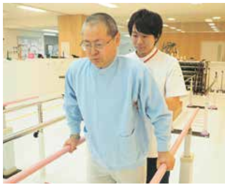
地域包括ケアシステムの確立に向け、医療と介護の連携を推進します

介護予防の取り組みとして、医療、介護、健康の相談および地域の高齢者などの交流の場となる「街かどケアカフェこぶし」を、本年4月、谷原出張所内に開設します。近隣の高齢者相談センター支所を同出張所内に移転し、相談から支援まで一体的な運営を行います。