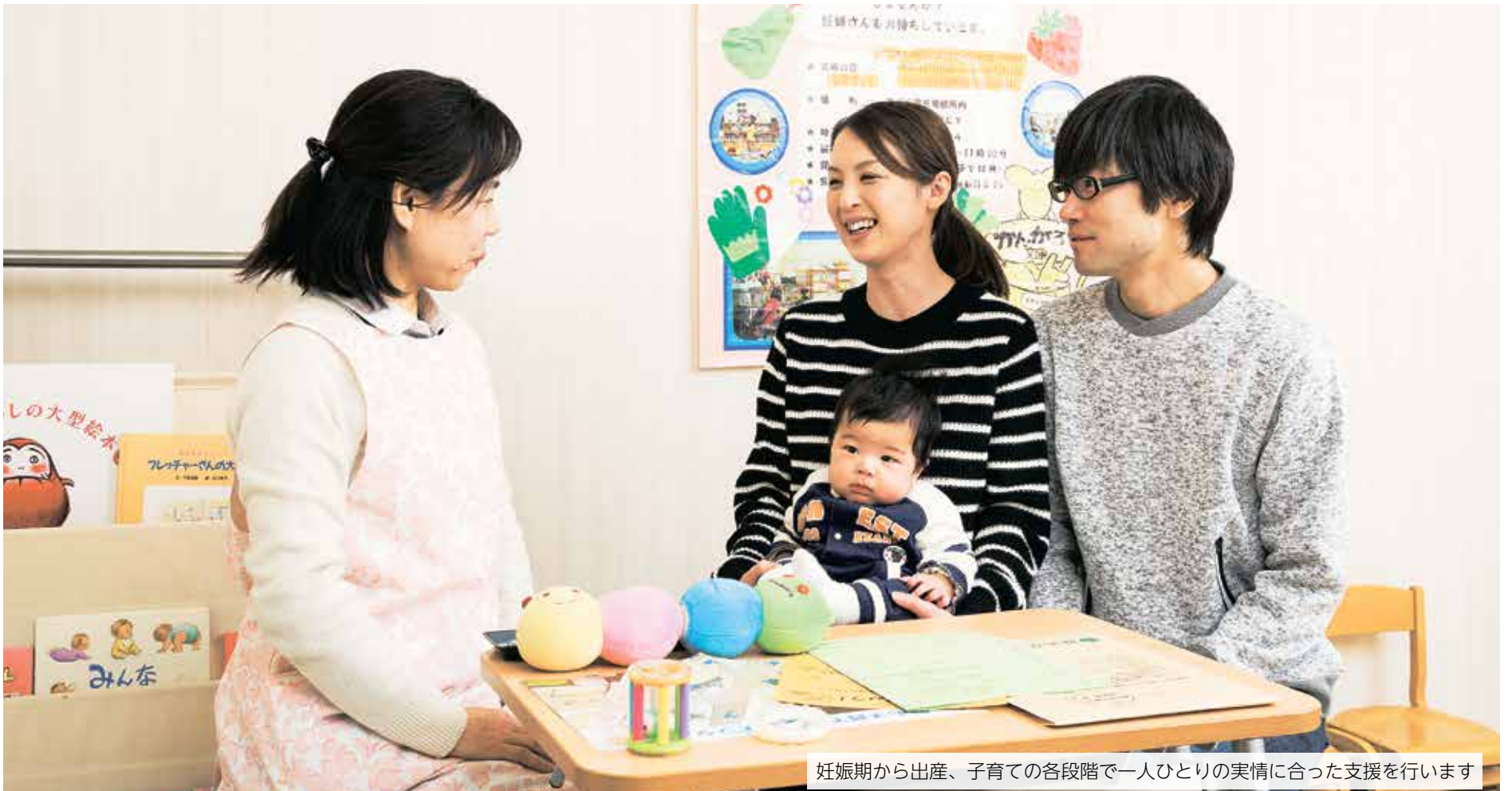
妊娠期から出産、子育ての各段階で一人ひとりの実情に合った支援を行います