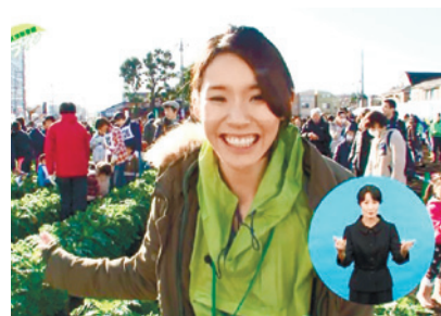
渋谷遥華キャスターの現場リポートも必見です!