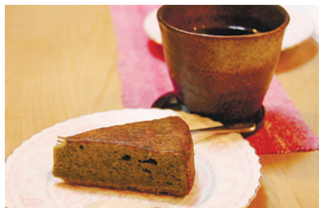
ねりコレ認定のねりま小松菜ケーキ

ち上げたのが、ネリマ・ベジタブル・カフェです」 現在のメンバーは、10人前後。ハーブセラピストや管理栄養士、イラストレーター、絵本作家など、さまざまな職業の方が、それぞれのスキルを生かしてボランティアでイベントを行っていると言います。