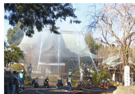
昨年の消防演習の様子

文化財防火デーに合わせて行われる消防署の消防演習を見学できます。 ※事前の申し込みは不要です。 ▶日時:1月26日(月)午前10時30分~11時 ▶場所:教学院(大泉町6-24-25) ▶問合せ:伝統文化係 ☎5984-2442