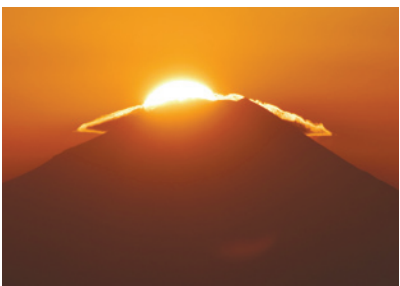
区役所本庁舎20階展望ロビーから見たダイヤモンド富士(区公式フェイスブックに掲載しています)

区政情報だけでなく、発信担当者が実際に「まちの話題」やイベントなどを取材・体験し、その感想や現場の臨場感を伝えていきます。