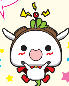
練馬区公式アニメキャラクター「ねり丸」©練馬区