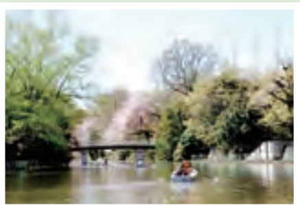
みどりの拠点(武蔵関公園)

みどりはまちに潤いを与え、都市生活を豊かにします。みどりの拠点(公園・緑地)とみどりの軸(河川・都市計画道路)により、みどりのネットワークをつくります。