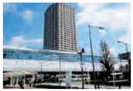
地域拠点として整備を進めている石神井公園駅周辺

駅周辺は、多くの通勤・通学者が利用し、日常生活を支える拠点となっています。区内の各駅周辺を、地域の特性に応じて、「中心核」「地域拠点」「生活拠点」とし、機能を向上します。