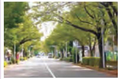
豊かな街路樹が広がる都市計画道路(補助172号線)

移動の重要な手段である鉄道と、交通、環境、防災などさまざまな機能がある都市計画道路のネットワークを形成し、移動の円滑化を進めます。