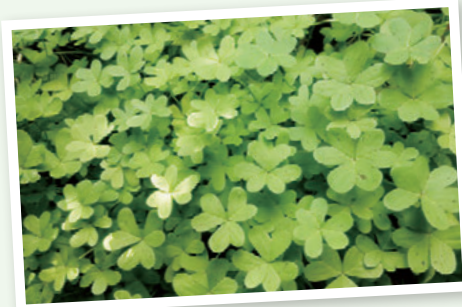
美しく鮮やかなみどり色の葉っぱたち

つくり上げ、区民参加のテレビCMを制作し、発信していきます。申し込み方法など詳しくは、5月29日(金)までにお問い合わせください。 ▶問合せ:広報戦略係 ☎5984-1089