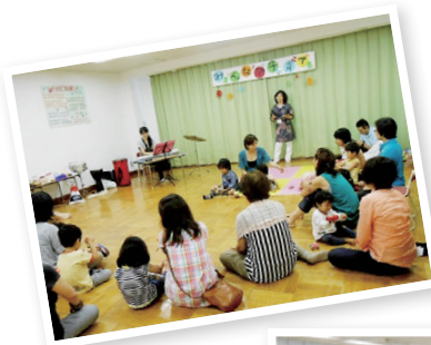
大人も子どもも楽しめるイベントが盛りだくさん!