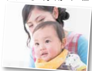
乳幼児一時預かり事業の実施日時など(1月12日(火)以降)

1日2単位 (3時間1単位)まで利用できます。利用を希望する施設で事前に登録が必要です。登録方法など詳しくは、お問い合わせください。区ホームページ「子育て」の「保育が必要なき」の「乳幼児一時預かり」をご覧ください。▼対象:区内在住の6カ月以上の未就学児 ▼利用料金(子ども1人1単位当たり):0歳児:2000円、1歳児以上:1500円