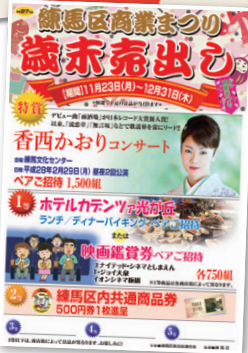
このポスターが目印

期間中、各商店街では趣向をこらしたイベントを開催します。ぜひお近くの商店街をご利用ください。※期間などは、商店街によって異なります。▶問合せ:練馬区商店街連合会 ☎3991-2241 (平日午前9時～午後5時)、区役所内商工係 ☎5984-2675