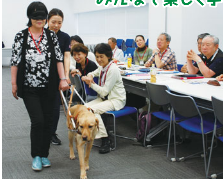
視覚障害のある方について理解を深める講義