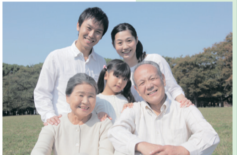
アクションプランの全文といただいたご意見の閲覧場所

アクションプランの策定に当たっては、区民意見反映制度により、17 名・2 団体から 72 件のご意見をいただきました。