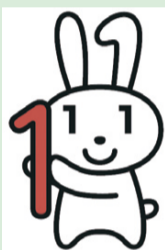
マイナンバー制度 キャラクター 「マイナちゃん」

マイナンバー制度(社会保障・税番号制度)は、行政を効率化し、国民の利便性を高め、公平・公正な社会を実現するための社会基盤です。今回、マイナンバー制度の導入に当たり、「練馬区におけるマイナンバー制度の活用に向けた取組方針(素案)」などがまとまりましたので、区民意見反映制度によりご意見を募集します。