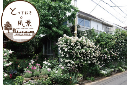
【まちかど部門】「桜台の家」の庭から広がる「まちの庭」(平成26年度登録)

までに応募してください。▶ 応募用紙の配布場所: 区民事務所(練馬を除く)、出張所、図書館(平和台を除く)、区役所庁舎案内横(本庁舎1階)、練馬まちづくりセンターなど ※練馬区地域景観資源登録ホームページ( http://nerimatotteoki.blogspot.jp/ )にも掲載しています。▶ 問合せ: 練馬まちづくりセンター ☎3993-5451