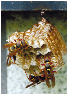
アシナガバチの巣

①ハチ用の殺虫スプレーを用意します。②長袖・長ズボン・帽子・手袋などをして、できるだけ肌の露出をなくしましょう。③日が暮れてから、ハチの巣に向けてスプレーを15秒程度噴射します。④翌日、手袋を着用して死んだハチと巣を処分してください。