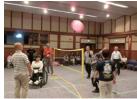
年1回実施するカレッジ祭