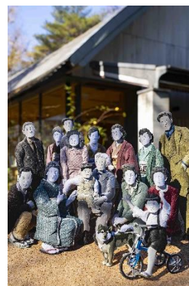
▲太田隆司氏の作品

申込：4月21日（火）より電話で石神井公園サービスセンター（03-3996-3950）にご連絡ください。