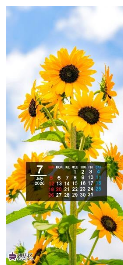
▲高松みらいのはたけのヒマワリ（7 月）