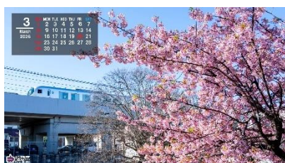
▲カワヅザクラと西武池袋線（3 月）（カレンダー付）