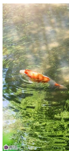
▲向山庭園の鯉（6 月） （カレンダー付）