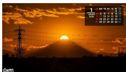
▲風の子公園から望むダイヤモンド富士（1 月）（カレンダー付）