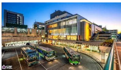
▲練馬駅北口ロータリー（12 月）