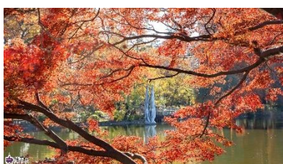
▲石神井池の紅葉（11 月）