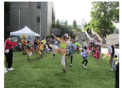
▲昨年のパレードの様子