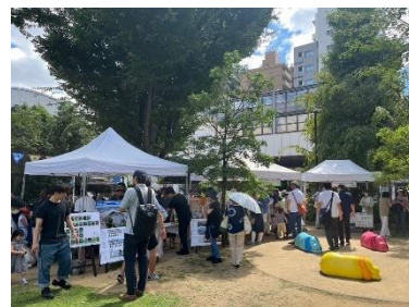
▲昨年の出店の様子