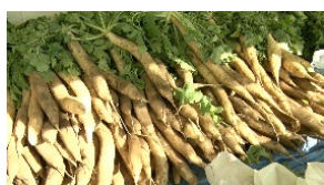
▲毎年大人気！練馬大根

参加都市（計9都市）：千葉県松戸市、東京都八王子市、国分寺市、神奈川県横浜市、静岡県浜松市、愛知県名古屋市、京都府京都市、兵庫県神戸市、広島県広島市