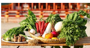
▲九条ネギや水菜などの京の旬野菜