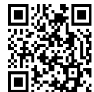
▲講演会申込フォーム