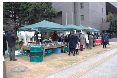
▲美術の森緑地での出店