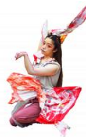
▲プロのパフォーマーと一緒に 衣装・ダンス作成