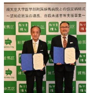
▲協定締結式の様子