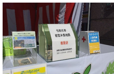
【新年賀詞交換会で設置した募金