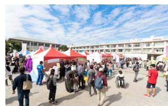
▲第45回練馬まつりの様子

模擬店やステージパフォーマンスの他、今年、開設された「ワーナーブラザース スタジオツアー東京」をみんなで盛り上げよう！とマロニエ通りを会場に「シティ・ウィザード・ストリート」を展開。オリジナル魔法メニューやフォトスポットで皆様をお待ちしています。 また、ヒーローショーや友好都市上田市による真田陣太鼓といった迫力満点のステージイベントも子どもたちに大人気です。はたらくるまの展示も行います！！