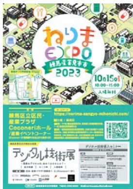
▲「練馬産業見本市 ねりま EXP02023」ポスター

産業見本市公式サイト https://nerima-sangyo-mihonichi.com/