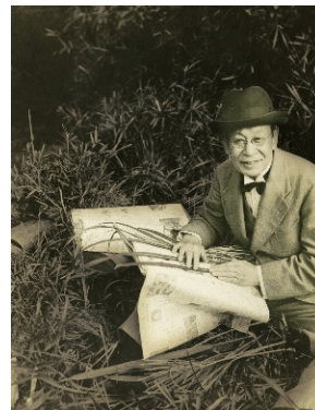
▲牧野富太郎博士 稲毛にて（昭和16年9月28日撮影）