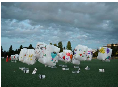
▲野菜などのイラストが描かれたランタン