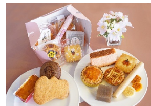
▲詰め合わせギフト（イメージ）