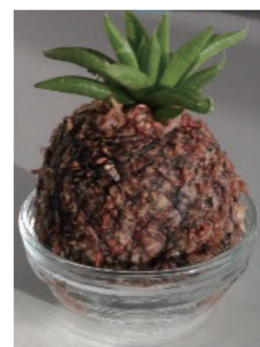
▲記念品の多肉植物