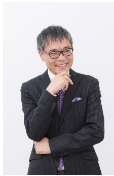
▲いとうせいこうさん