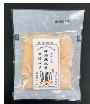
▲交流会をきっかけに開発された「練馬産生姜の厚切り」

(業種別内訳) 食料品製造業9者、飲食業7者、障害者福祉5者、 その他サービス業3者、製造業1者、卸売業1者、小売業1者、 情報通信業1者