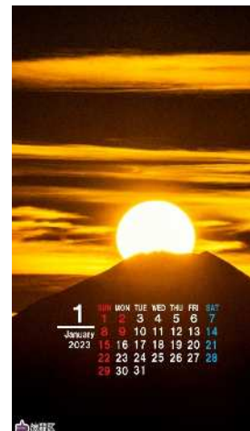
区役所からのダイヤモンド富士山(1月) スマートフォン版 (カレンダー付)