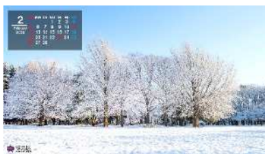
冬の光が丘公園(2月) (カレンダー付)