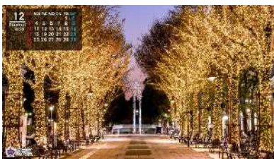
光が丘の「ふれあいの径 イルミネーション」(12月) (カレンダー付)