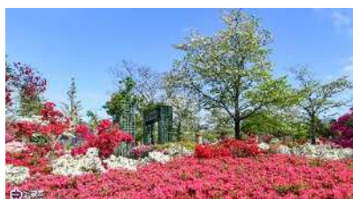
平成つつじ公園(4月)