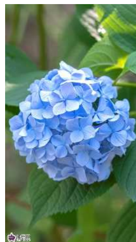
ヒメアジサイ(6月) スマートフォン版