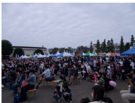
【開進第二中学校会場の様子】