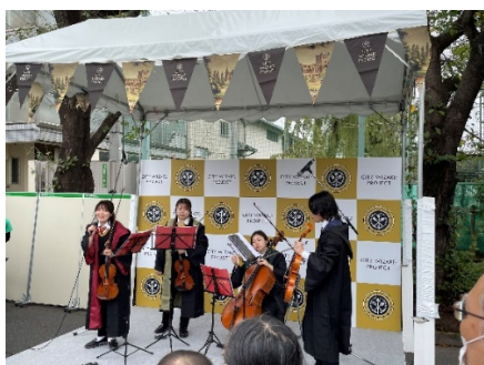
【シティ・ウィザード・ストリートの様子】