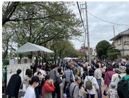
【マロニエ通りの様子】