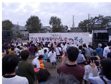
【すずしろステージの様子】