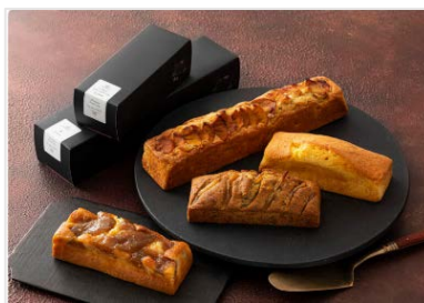
▲掲載商品例① ほっとすぺーす練馬 「プレミアムパウンドケーキ」