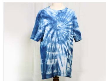
▲掲載商品例② ねりま第二事業所 「藍染めTシャツ」

【問合せ】 練馬区 障害者施策推進課 就労支援係 電話：03-5984-1387