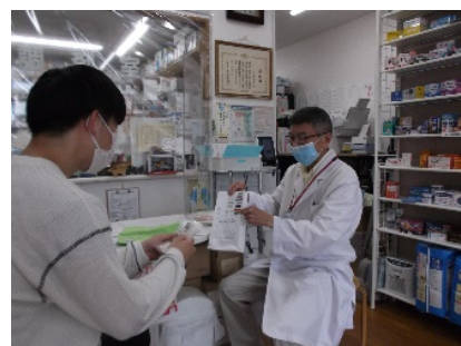
▲かかりつけの薬局で薬剤師が服薬の助言・指導（イメージ）