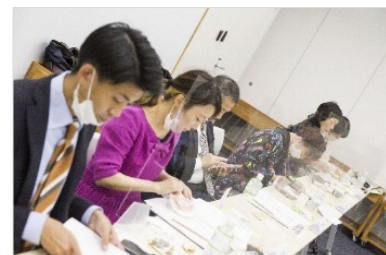
▲外部審査員による審査の様子