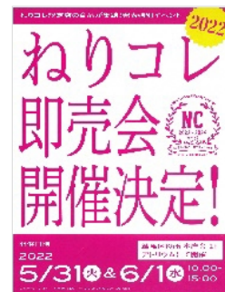
▲「ねりコレ即売会」チラシ

日 時: 5月31日(火)・6月1日(水) 両日とも午前10時~午後3時 場 所: 練馬区役所本庁舎1階 アトリウム 出店数: 各日14~16店舗