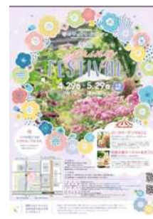
フェスティバルチラシ

内 容：ローズガーデンの職員ならではの視点で、施設の見どころを解説しながらご案内します。