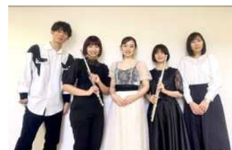
日本大学芸術学部音楽学科