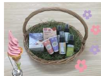
四季の香マーケット&カフェ