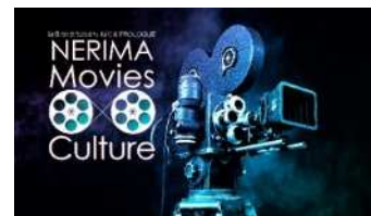
「映像 文化のまち ねりま PROLOGUE」のメインビジュアル

区には、昭和7年（1932年）に向山（豊島園）に不二映画撮影所が設立されて以降、実写・アニメを問わず映像を作る環境が整っており、数多くの優れた映像作品がこの練馬の地からつくり出されてきた。こうした状況を背景に、区は令和3年度に「映像 文化のまち構想」を策定し、映画やアニメなどの映像文化を活かした、ソフト・ハードが一体となった夢のあるまちづくりを進めていく。