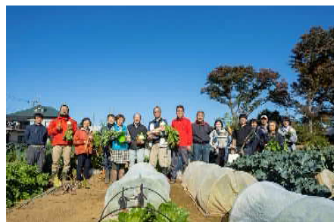
農業体験農園の利用者の皆さん