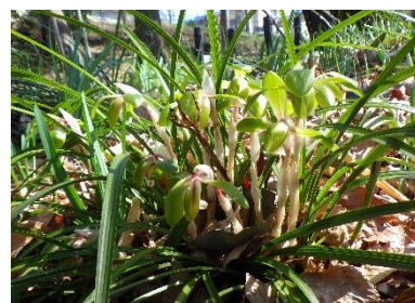
▲咲き始めのシュンラン

開放期間中には、毎日9時から17時までカタクリの生態や清水山の森に生育する植物などを説明する「カタクリガイド」が常駐し、希望者は説明を聞くことができる(申込みは現地受付、予約不要)。今年、新型コロナウイルス感染症の拡大防止のため、ガイドはマスク着用のうえ解説を行う。また、カタクリの他にもシュンランなどの野草を見ることができ、例年、期間中には約7千人が訪れる。