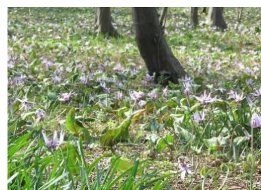
▲カタクリが群生して咲く様子(去年の様子)

カタクリは、種子から花が咲くまでに7～8年かかり、草丈は10cmほど。2枚葉を出し、2枚の葉から出る茎の先に花をつける。花は通常薄紫色で下を向き、6枚の花びらを外に反り返らせて咲くのが特徴。一株の開花期間は一週間程度で、例年3月下旬から4月上旬にかけて次々に咲き始める。