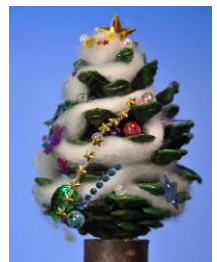
▲ 作品例「松ぼっくりのクリスマスツリー」

内容：緑化協力員と一緒に、自然の素材を使って作品（松ぼっくりのクリスマスツリーなど）を作ります。