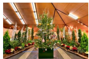
▲ 昨年の花とみどりのクリスマス展

内容:クリスマスツリーの飾り付けを行います。参加して下さった方に植物の種などを差し上げます(景品はなくなり次第配布終了)。