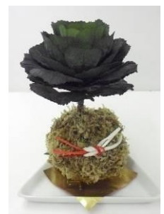
▲ 作品例「お正月に飾るこけ玉」