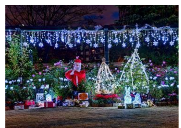
▲ 昨年のイルミネーション

内容:花とみどりの相談所の室内展示とローズガーデンが、イルミネーションで彩られます。また、21日(土)、22日(日)限定で、ガーデンの開園時間を午後7時まで延長。イルミネーションをガーデン内でお楽しみいただけます。